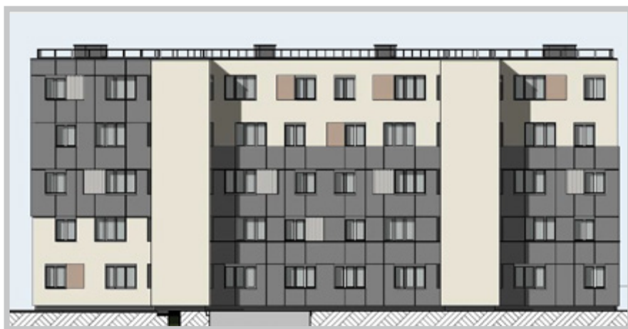
Projection graphique de la réhabilitation.

Le coût de tous ces travaux est de l'ordre de 4 millions d'euros.